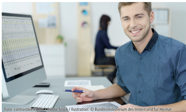
Foto: contrastwerkstatt / Adobe Stock / Illustration: © Bundesministerium des Innern und für Heimat

chen. Andererseits konnten Fachverbände wie der Deutsche Steuerberaterverband e.V. (DStV) die Regelungen inhaltlich auf ihre Praxis-tauglichkeit prüfen und dem Ministerium Rückmeldung geben. Nun ist das finale Einführungsschreiben erschienen (BMF, Schreiben vom 15. Oktober 2024, Gz. III C 2 – S 7287-a/23/10001 :007). Dabei hat das Finanzministerium viele der Anregungen aus der Praxis ins finalisierte Schreiben aufgenommen.